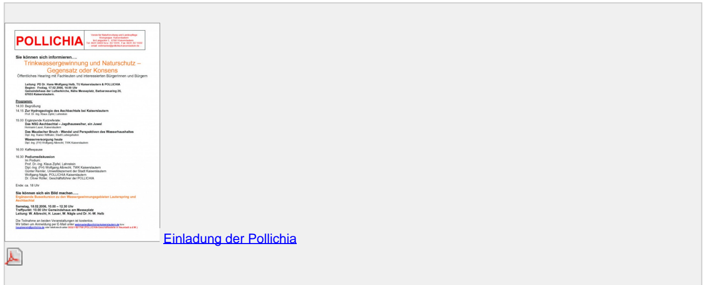
Einladung der Pollichia

Hearing der Pollichia, Verein für Naturforschung und Landespflege, Kreisgruppe Kaiserslautern. Mit den Referenten kommen hervorragende Fachleute zu Ihrer Information und es ist sehr wichtig das große Interesse der Bevölkerung zur Aufgabe Trinkwasserversorgung gerade auch wegen der Austrocknung von Gewässern zu zeigen. Das Motto "Gegensatz oder Konsens" ist treffend gewählt.